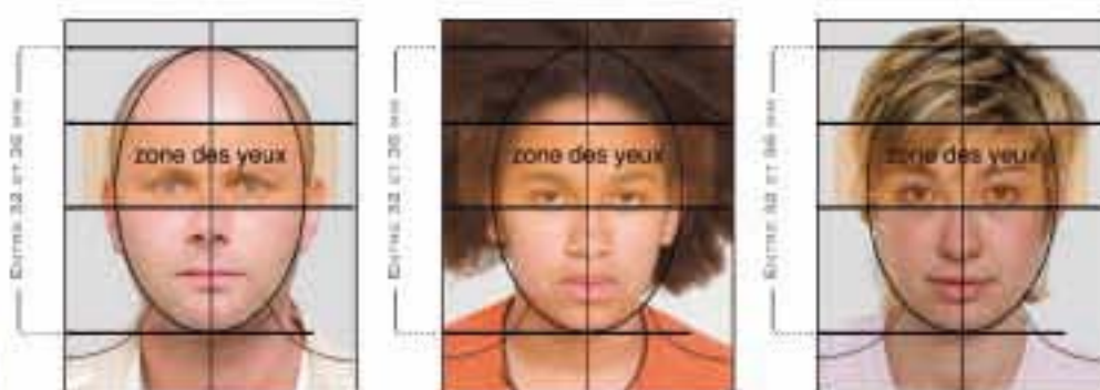
CONFORME À LA NORME ISO/IEC 19794-5 : 2005